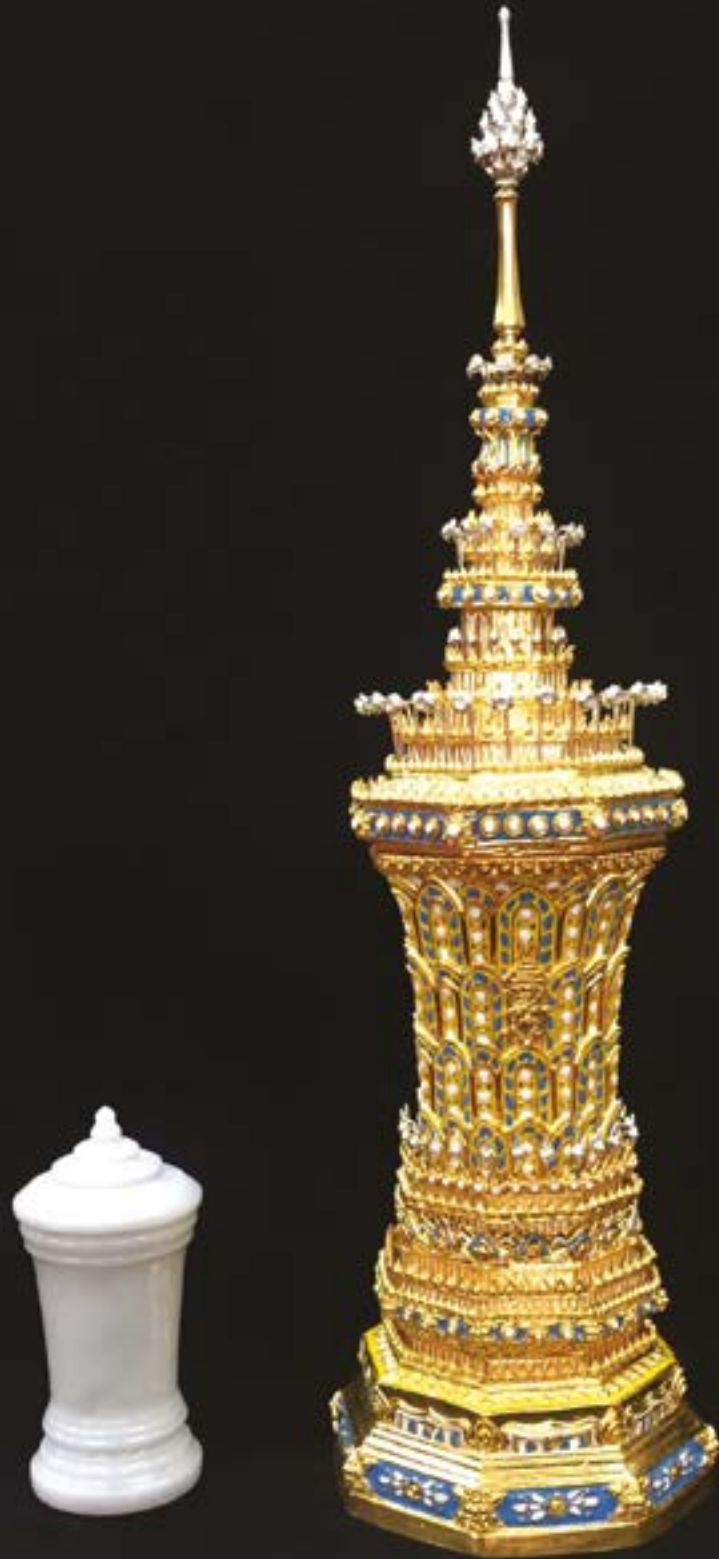
พระโกศทองคำลงยาสำหรับพระอัฐิ สมเด็จพระสังฆราชเจ้า กรมหลวงวชิรญาณสังวร ประดิษฐาน ณ หอพระนาค